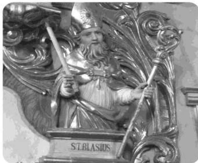
Pfarrkirche Niederolang

Der heilige Blasius (Festtag: 3. Februar) war ein Bischof, der auch in schweren Zeiten Gott die Treue hielt und Menschen aus ihrer Not errettet hat. Mit dem Blasiussegen hoffen wir, dass auch wir in Notzeiten Licht sehen. Licht, das uns daran erinnert, dass wir auch dann im Licht Jesu sind, wenn wir krank werden oder Sorgen haben.